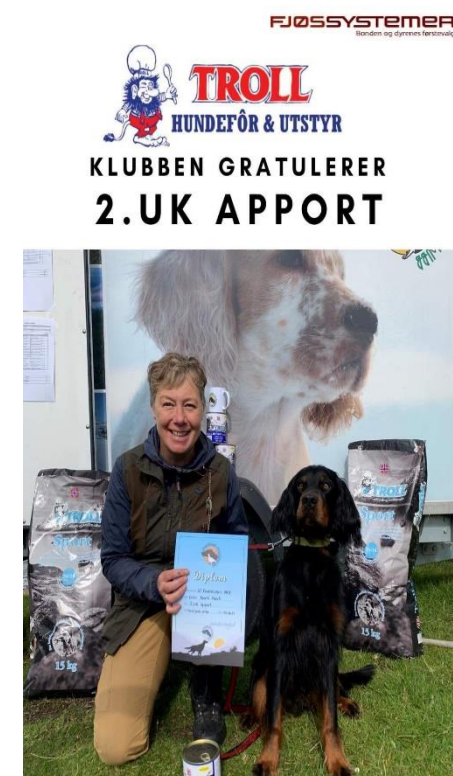
Gordon setter Pointmanns NOX