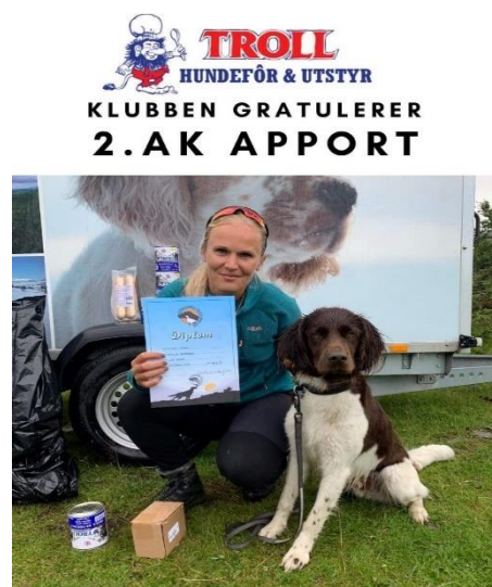
Kleine Münsterländer Storm