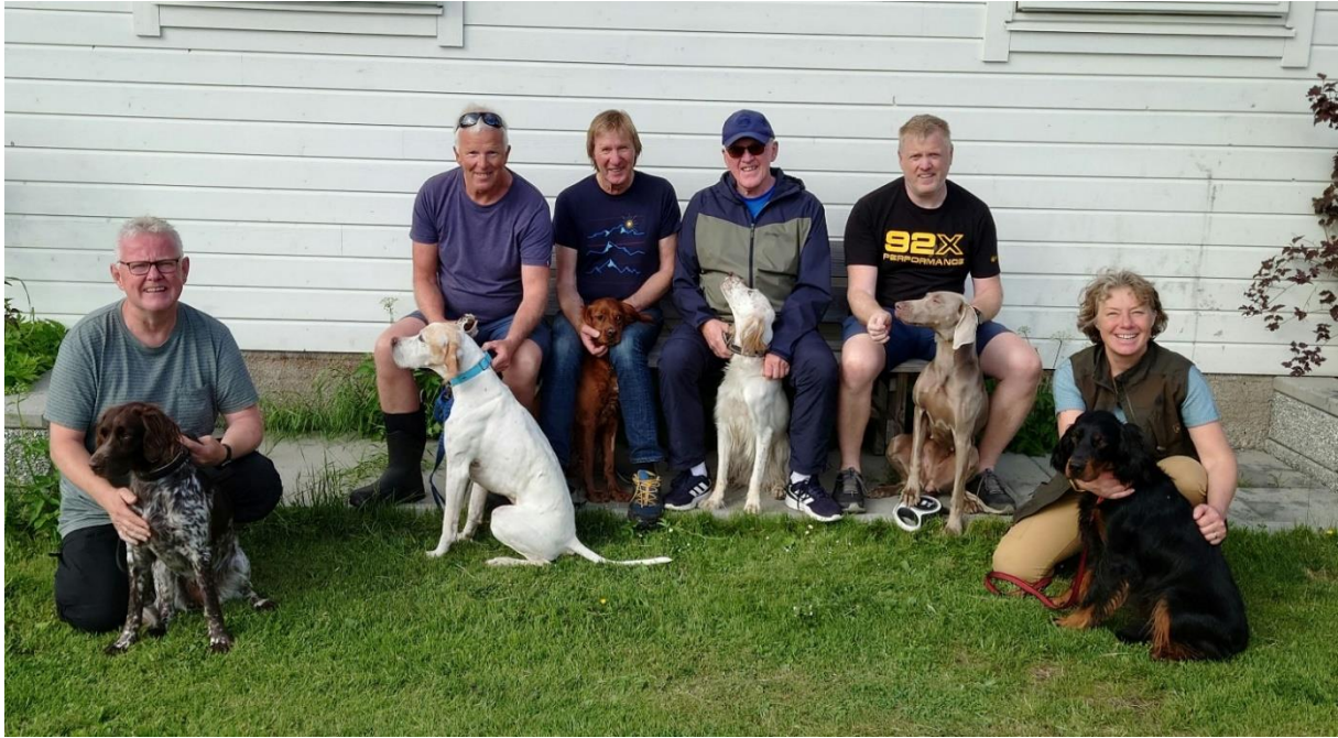
Apportbevis er i boks ✓