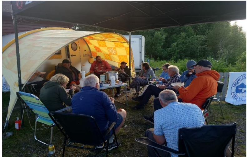
Rømmegrøt, gode historier og hyggelig prat, etter hvert flyttet vi oss alle inn i storhytta.